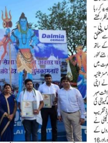
में حضور वाला, को अर्वाड सेरेमनी के दौरान सम्मानित किया गया

देशीय समाजिक कार्यकर्ता का कार्य है - DBL के सत्र और शिक्षण कार्यक्रमों के माध्यम से समाज में परिवर्तन लाने का प्रयास करना है। डालमिया भारत लिमिटेड ने देवघर में श्रावणी मेले के अवसर पर समाजिक परिवर्तन की पहल की है।