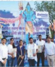
में حضور वाला, को अर्वाड सेरेमनी के दौरान सम्मानित किया गया

देशीय समाजिक कार्यकर्ता का कार्य है - DBL के सत्र और शिक्षण कार्यक्रमों के माध्यम से समाज में परिवर्तन लाने का प्रयास करना है। डालमिया भारत लिमिटेड ने देवघर में श्रावणी मेले के अवसर पर समाजिक परिवर्तन की पहल की है। कंपनी ने देवघर में श्रावणी मेले के अवसर पर समाजिक परिवर्तन की पहल की है।