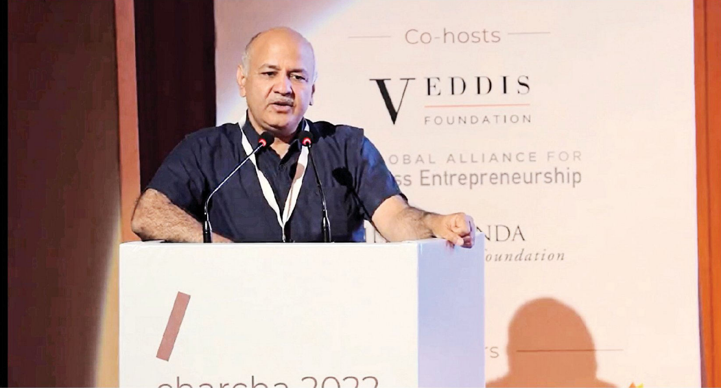
தில்லியில் வியாழக்கிழமை நடைபெற்ற மாநாட்டில் பேசிய துணை முதல்வர் மணீஷ் சிசோடியா.

புது தில்லி, ஆக. 4: கேஜரிவால் அரசின் 'பிசினஸ் பிளாஸ்டர்ஸ்' திட்டம் மாணவர்களிடையே தொழில் முனைவோர் மனப்பான்மையை வளர்ப்பதிலும், ஆர்வத்தை வளர்ப்பதிலும் வெற்றி பெற்றுள்ளது என்று தில்லி துணை முதல்வர் மணீஷ் சிசோடியா தெரிவித்தார். 'தி/நட்ஜ்' நிறுவனம் ஏற்பாடு செய்திருந்த வாழ்வாதார உச்சி மாநாடு வியாழக்கிழமை நடைபெற்றது. இந்த மாநாட்டில் அளர் பேசியதாவது: 'பிசினஸ் பிளாஸ்டர்ஸ்' திட்டம் என்பது தொழில் முனைவோர் மனப்பான்மை பாடத் திட்டத்தின் ஒரு விளிப்பு நடுத்தப்பட்ட செயல்முறை அங்கமாகும். இந்தத் திட்டத்தின் கீழ் 11, 12-ஆம் வகுப்பு மாணவர்களுக்கு வணிக யோசனைகளை வளர்ப்ப தற்காக உணர்வுகூட்டுதலாக தவிர 2,000 வழங்கப்படுகிறது. மேலும், அரசு நடத்தும் உயர் நிலைப் பல்கலைக்கழகங்களில் தில்லி அரசுப் பள்ளிகளின் 'பிசினஸ் பிளாஸ்டர்ஸ்' அணிகளின் இறுதிப் போட்டியாளர்களுக்கு அரசு நேரடியாக அனுமதி வழங்குகிறது.