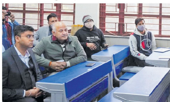
தில்லி சிவில் லைன்ஸில் உள்ள அரசுப் பள்ளியில் புதிதாக அமைக்கப்பட்டுள்ள பொலிவுறு வகுப்பறைகளை (ஸ்மார்ட் வகுப்புகள்) விழாவுக்கிழமை ஆய்வு செய்த துணை முதல்வர் மணோசி சிசோடியா.