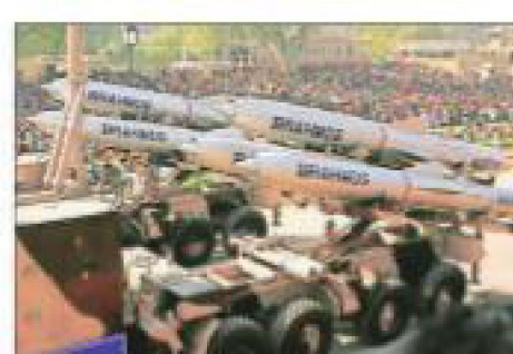
Philippines signs $374-million contract for shore-based anti-ship BrahMos missiles for its navy

"The BAPL is a joint venture company of the Defence Research and Development Organisation (DRDO). The contract is an important step for-